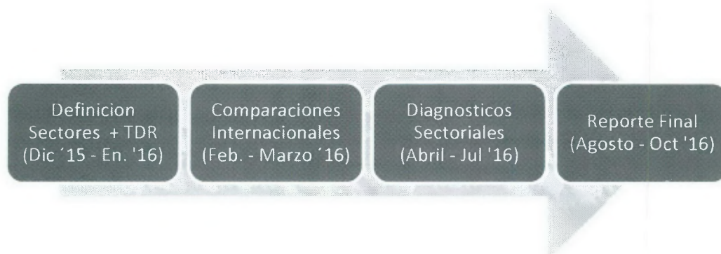
Grafico N° 1 – Principales Fases y Cronograma General del PER

9. Fase III: Consolidación de los resultados en un Reporte Final (Agosto – Octubre). Basados en la retroalimentación de las contrapartes pertinentes en las dos fases anteriores , los equipos sectoriales del Banco Mundial preparan versiones finales de cada capítulo correspondiente a los Sectores Educación, Salud y Economía. Posteriormente el equipo del BM responsable por la coordinación general del Estudio consolida los resultados y recomendaciones en un capítulo de Visión General que contiene las principales recomendaciones y los posibles ahorros potenciales . A su vez se prepara un segundo volumen del Reporte que contiene los capítulos individuales para cada Sector analizado Este trabajo se realiza en coordinación con la DIPRES y el MH.